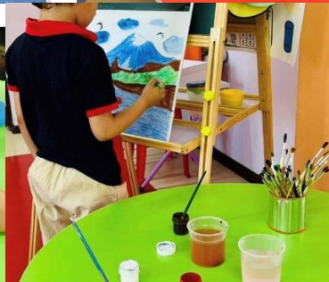
2.1 Գործնական աշխատանք